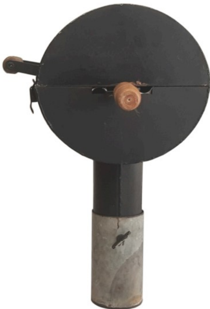
Fig. 1.5 Vista lateral direita