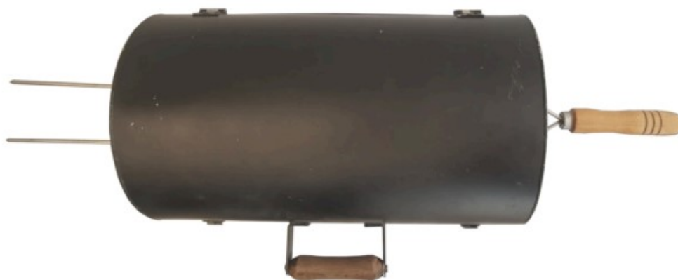
Fig. 1.6 Vista superior