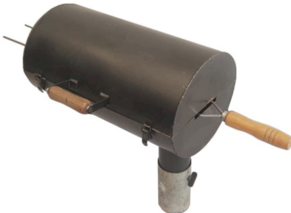
Fig. 1.1 Perspectiva