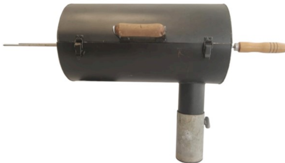
Fig. 1.2 Vista anterior