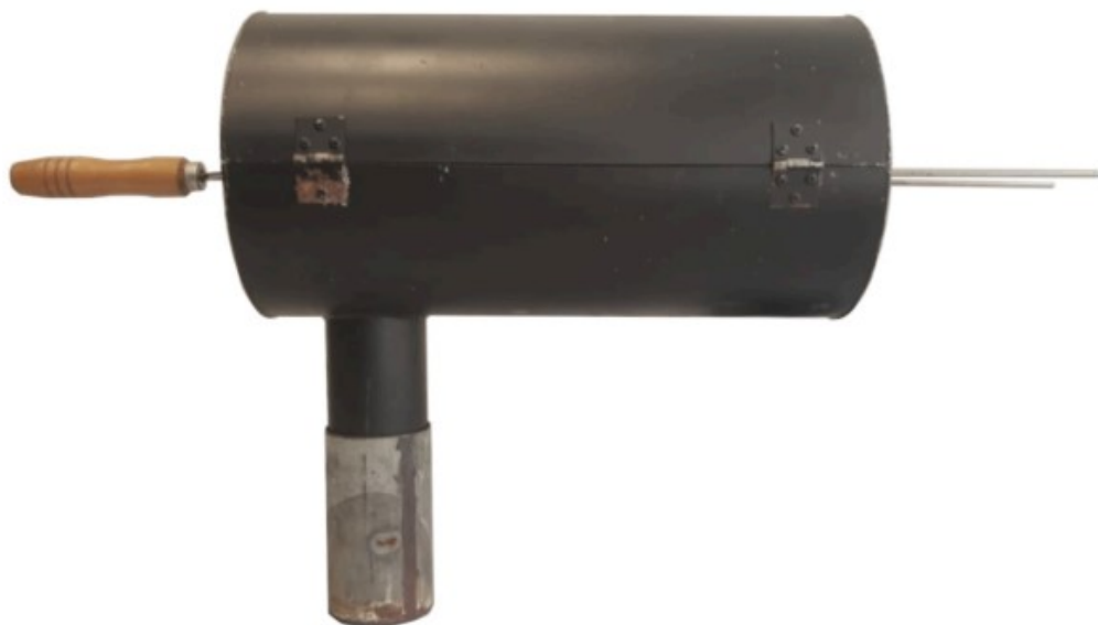
Fig. 1.3 Vista posterior