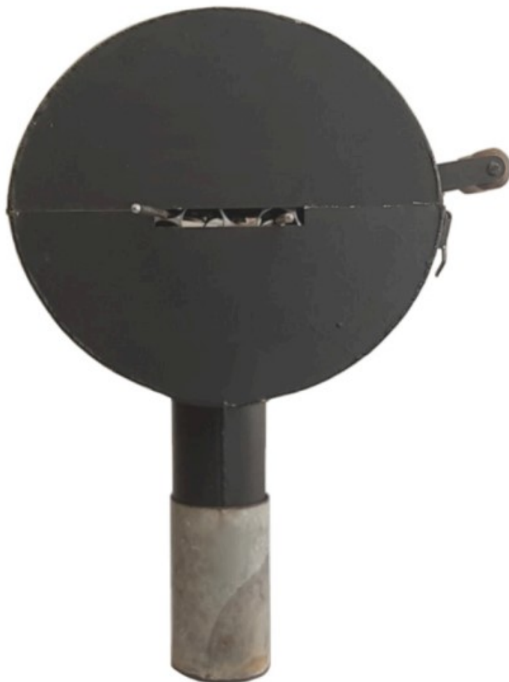
Fig. 1.4 Vista lateral esquerda