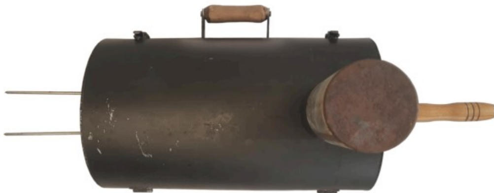
Fig. 1.7 Vista inferior